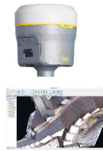
TOWISE CAD HC